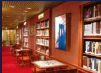
ライブラリー&クロスワードテーブル