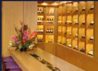
ワインギャラリー