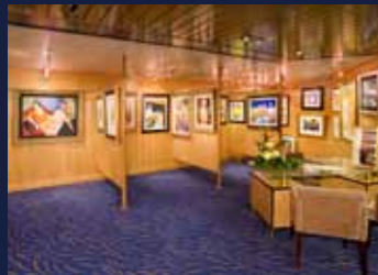
アートギャラリー

コーヒーハウス風の Explorations café(フード無料・ドリンク有料)では、ベストセラーから情報収集用の書籍、さらにインターネット(有料)の設備が整っております。