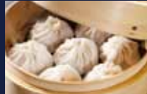
繊細な味付けの台湾料理も楽しみです。

台湾の北端に位置する基隆は、古くは現地語に漢字をあてた「鷓鴣籠(ケーラン)」と呼ばれていました。清朝統治時代に「基地昌隆(繁栄の基地となる)」の意を込めた現在の「基隆」となり、台湾だけではなく、世界有数の貿易港として、また台北の衛星都市として発展してきました。この基隆を起点に台北や、どこか懐かしい街並みの九份、各国商館が残る淡水など台湾北部の見どころへ。